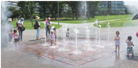
⬆ 公園の改修整備を順次実施 ⬆