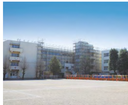
小中学校の大規模改修