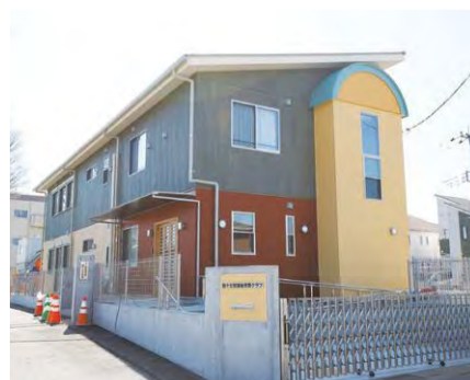
放課後児童クラブの建替え