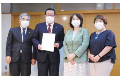
市議会議員団有志から出馬要請