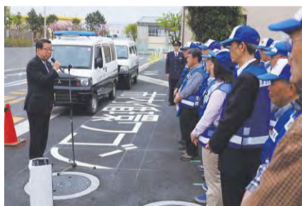
防犯パトロール隊の出発式