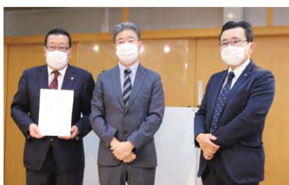
東入間医師会から出馬要請

私は、「市民の皆様命と暮らしを守るため、医療の最前線で闘い続けている医療関係者の皆様とともに、引き続き全力を尽くさなければならぬ」と、決意を固めたところでありました。