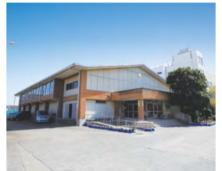
小中学校体育館のエアコン設置と改修