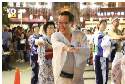
七夕まつり西口会場