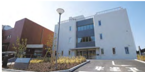
ステラ・イースト オープン