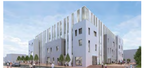
西地域文化施設(完成イメージ)