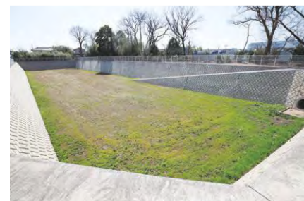
浸水被害解消のため調整池を整備