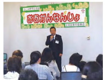
東日本大震災避難者支援