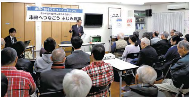
タウンミーティング