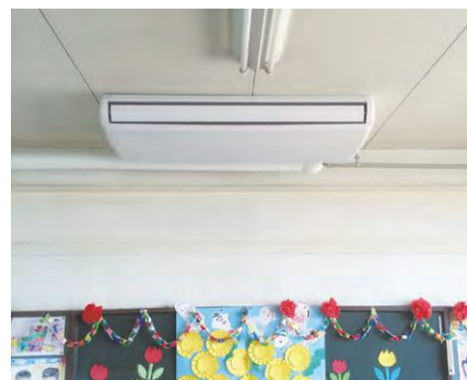
エアコンが設置された教室