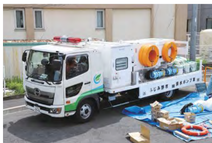
排水ポンプ車を配備