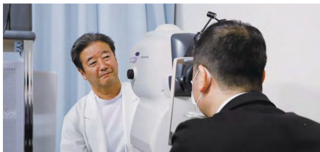
県内初の緑内障検診を開始