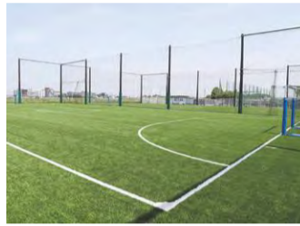
⬆ 東西両地域のスポーツ施設等をリニューアル ⬆