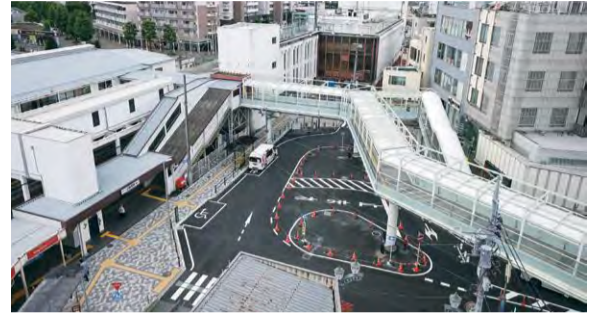
駅舎直通の横断歩道橋