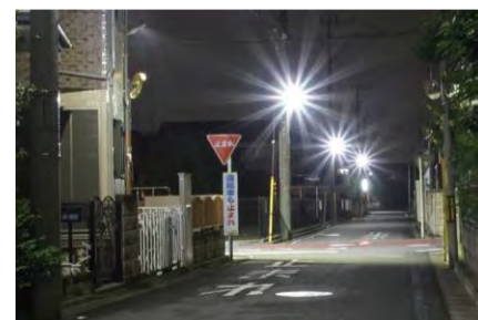
防犯灯・街路灯のLED化