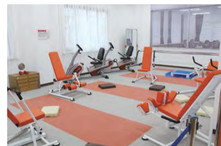
介護予防センターの外観と内部