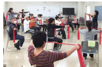
元気・健康マイレージ事業