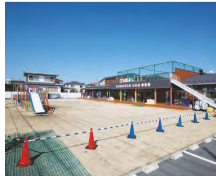
民間認可保育園の建設・運営を支援

認可保育園の建設や運営などを支援して保育サービスの向上と受入数の拡大を進めています。その結果、待機児童の解消に向かっていきます。