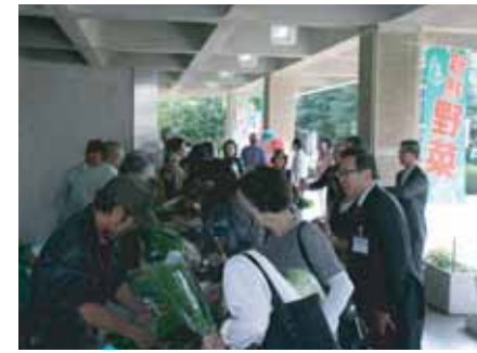
農産物の直売がスタート (H23.10)