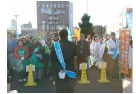
ごみポイ捨て禁止PR (H23.2)