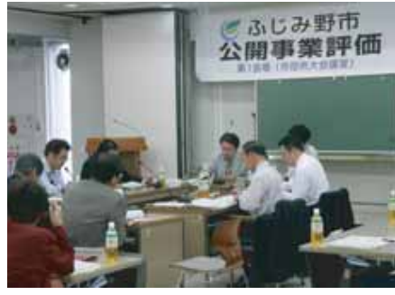
公開事業評価を開催 (H22.10)