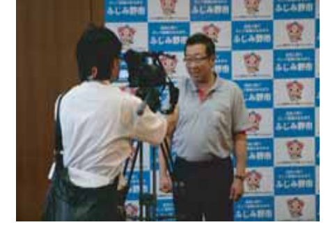
節電PRのTシャツ作成 (H23.8)