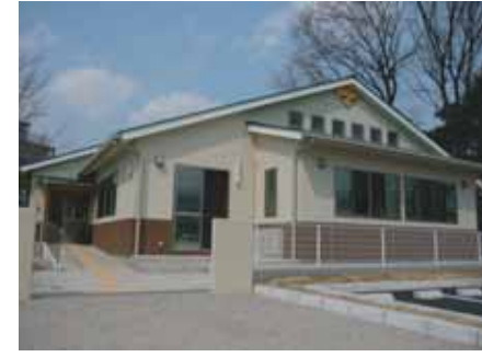
西放課後児童クラブを増築 (H23.3)