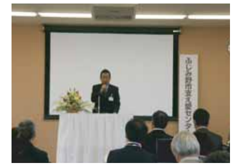
地域支え愛事業を開始 (H22.10)