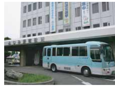
循環バスのエリア拡大 (H22.7)