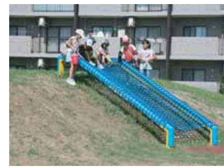
区画整理で元町西公園が開設 (H22.8)