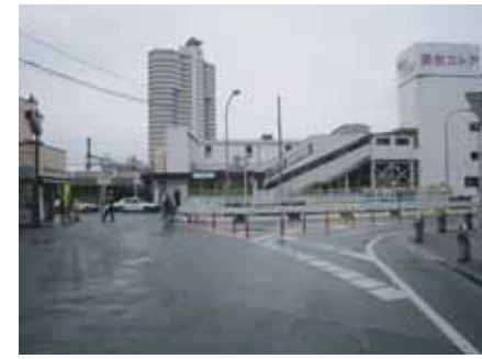
上福岡駅東口の整備が進む (H23.1)