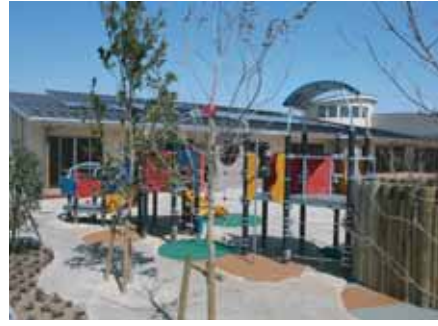
民間保育所の建設支援 (H23.3)