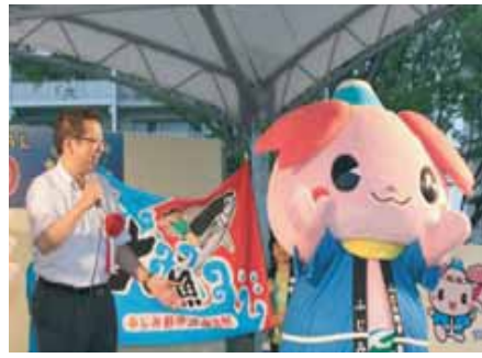
「ふじみん」お披露目 (H23.8)