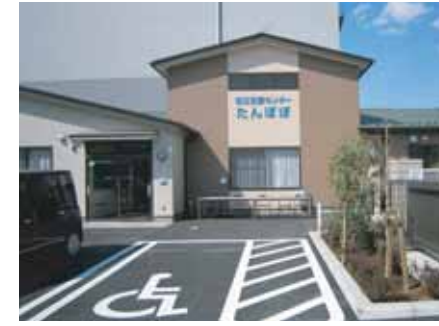
障がい者就労支援施設建設支援 (H23.3)