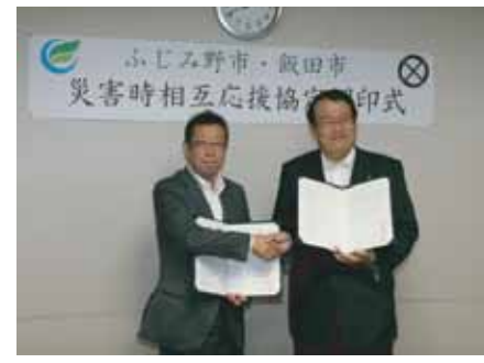
飯田市と災害協定を締結 (H22.7)