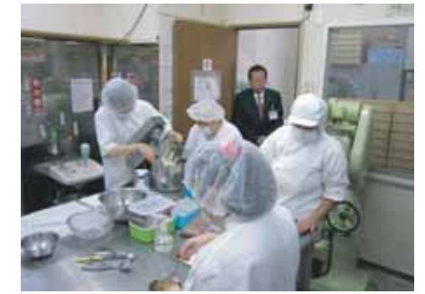
障がい者作業所を見学 (H23.11)