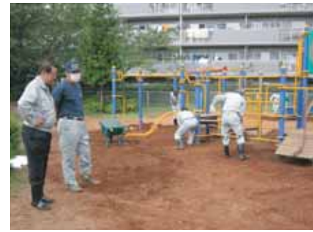
あすなろ公園の除染を実施 (H23.10)