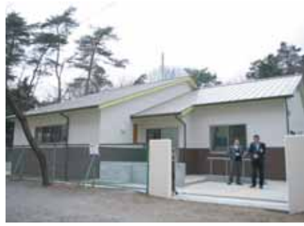
鶴ヶ丘放課後児童クラブを増築 (H23.3)