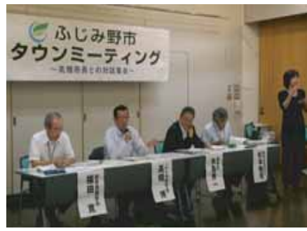
タウンミーティングを開催 (H22.6)